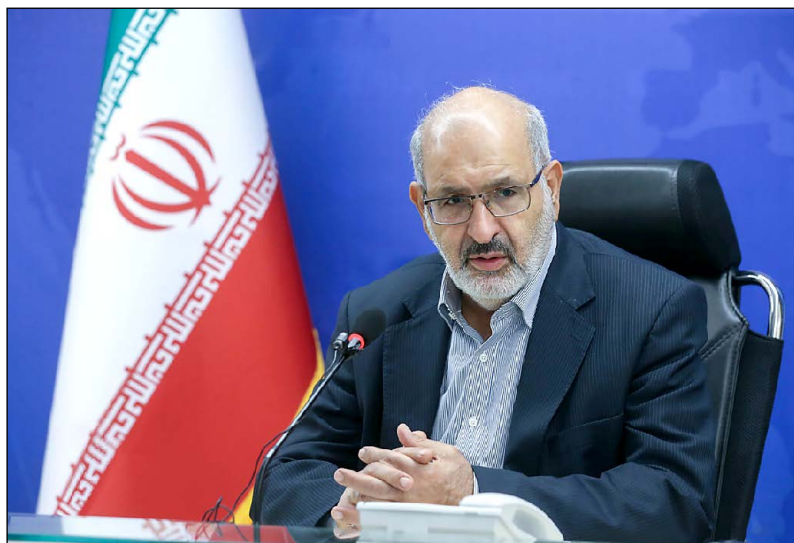
مشاور سرپرست سازمان ملی سنجش اعلام کرد