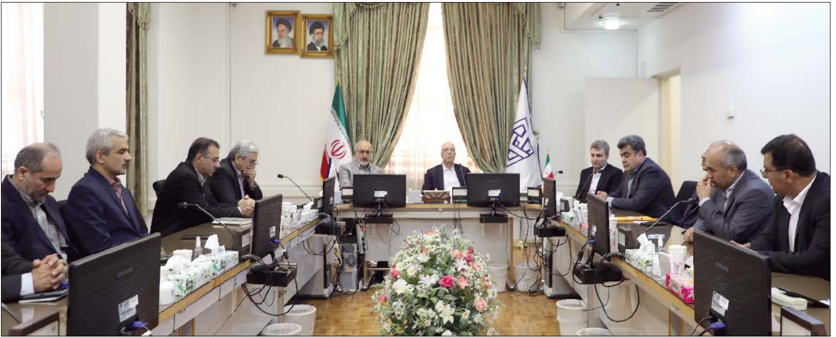
وزیر علوم در بازدید از سازمان سنجش آموزش کشور گفت:

سال بیست و نهم، شماره ۲ | دوشنبه ۲۷ فروردین ماه | سال ۱۴۰۳ | ۱۶ صفحه | شماره پیاپی ۱۳۷۰