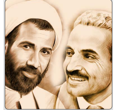
۸ شهریورماه سالروز شهادت مظلومانه شهیدان محمدعلی رجایی و محمد جواد باهنر به دست منافقان و روز مبارزه با تروریسم گرامی باد

۳- داوطلبان باید با در نظر داشتن شرایط خانوادگی و شخصی خود و محدودیت هایی