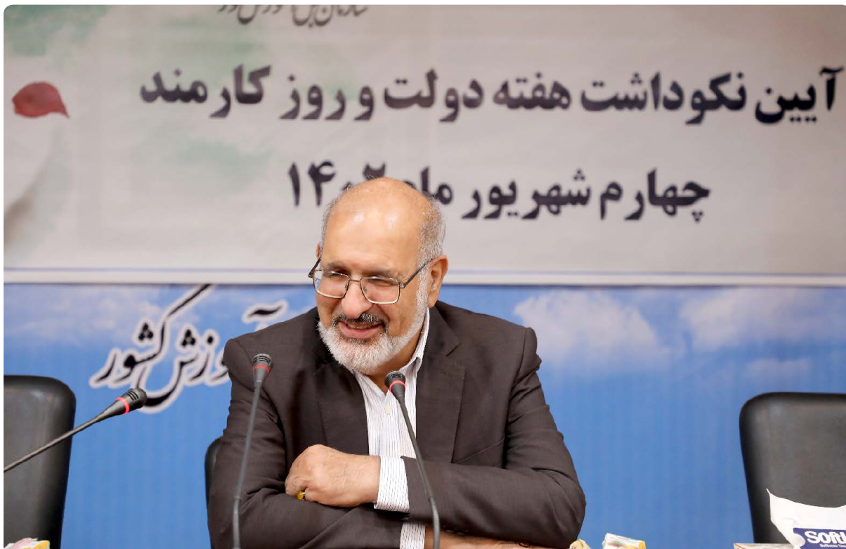
رئیس سازمان سنجش تأکید کرد