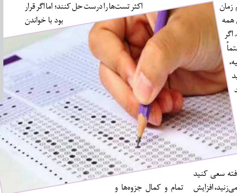
تمام و کمال جزوه‌ها و

اضافه آوردن زمان، به سؤالاتی که به آنها پاسخ نداده‌اید، باز گردید. نکته مهم در سرعت عمل، این است که اگر شما در موقع پاسخگویی، پاسخ سؤالی را فراموش کرده باشید، می‌توانید کنار آن سؤال، علامت مخصوصی بزیند و به بقیه سؤالات بپردازید و در مرحله آخر که وقت اضافه آوردید، با خونسردی و آرامش بیشتر در مورد آن سؤال فکر کنید. بیشتر دانش‌آموزان، پس از اینکه در دور اول تست زدن خود، تست‌هایشان را تصحیح می‌کنند، چون به تعداد زیادی از سؤالات خود پاسخی ندادند، به سراغ جزوه یا کتاب کمک درسی دیگری می‌روند؛ با این تصور که با دوباره خوانی و یا استفاده از منبعی دیگر، می‌توانند اکثر تست‌ها را درست حل کنند؛ اما اگر قرار بود با خواندن