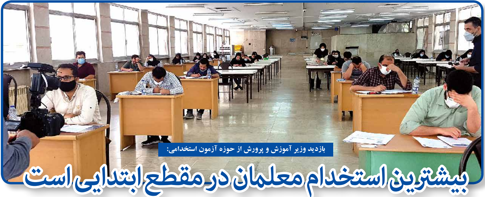
بازدید وزیر آموزش و پرورش از حوزه آزمون استخدامی: