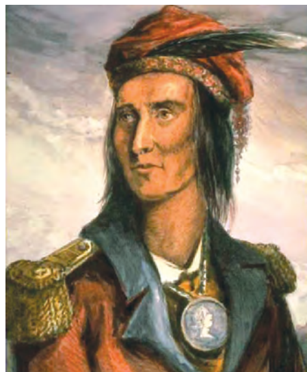
نگاره تکومسه (Tecumseh)، رهبر جنگجوی قبایل سرخ‌پوست که در برابر پیشروی سربازان آمریکایی مقاومت بسیاری کرد (اوایل قرن ۱۹ م).

با بررسی رفتار سفیدپوستان آمریکا با سرخ‌پوستان، که ساکنان اصلی آن سرزمین بودند و نیز بردگان سیاه‌پوست آفریقایی، میزان پایبندی دولت ایالات متحده به اعلامیه استقلال را تجزیه و تحلیل کنید.