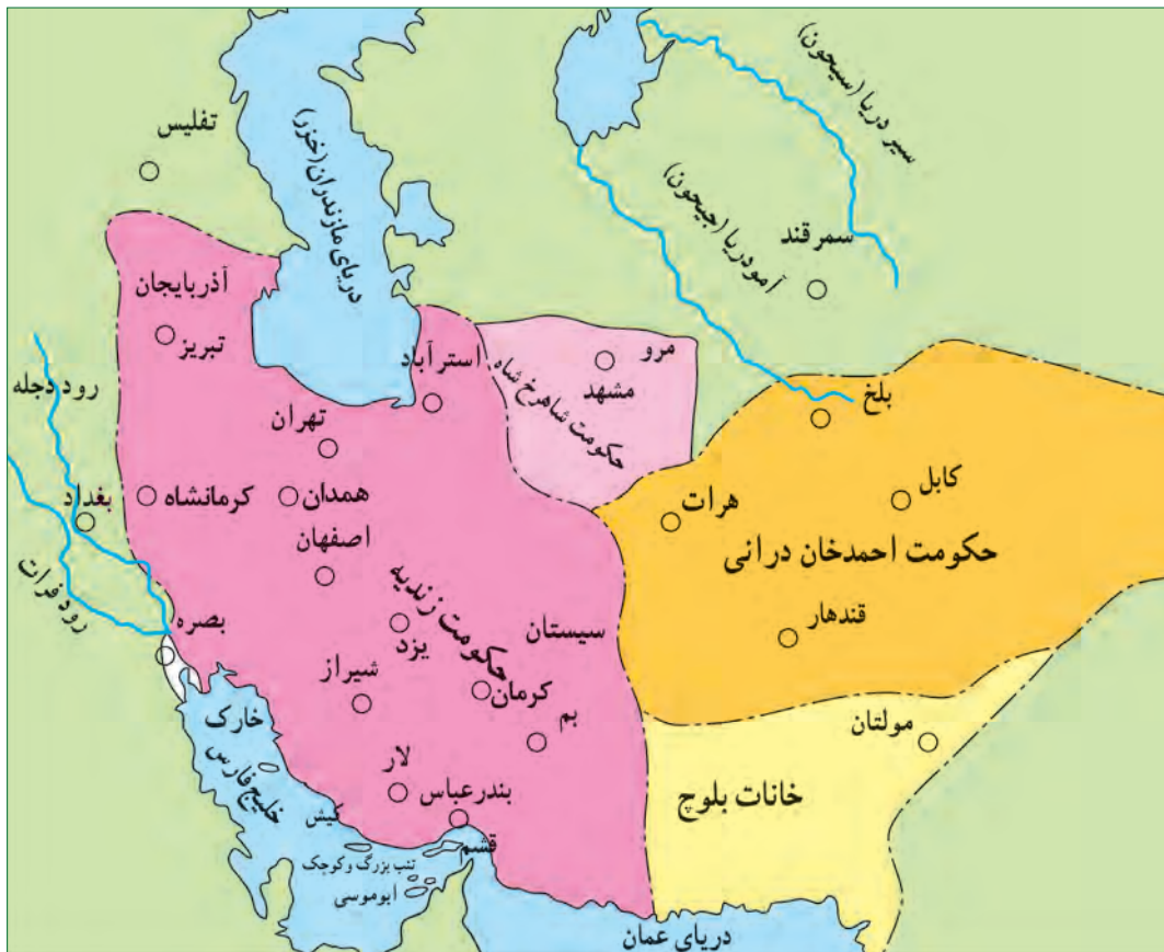
نقشهٔ ایران در دوران زندیه

کریم خان، برخلاف سنت معمول، از پذیرفتن عنوان شاه امتناع کرد و خود را وکیل مردم ایران (وکیل‌الرعايا) ۱ خواند. بعضی از خصوصیات اخلاقی کریم خان مانند مدارا با دشمنان، همدردی با مردم، ساده‌زیستی و رفتار مناسب با اقلیت‌های دینی و مذهبی باعث شده است که نام و نشان نیکی از او در تاریخ ایران به جا بماند.