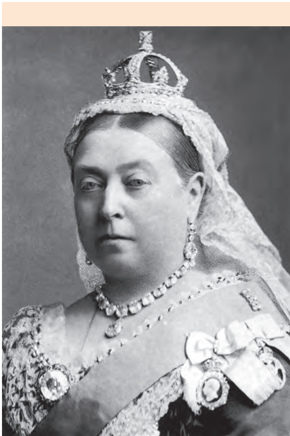
ملکه ویکتوریا (۱۸۱۹-۱۹۰۱ م)

انگلستان پس از انقلاب باشکوه، رقبای بزرگی همچون اسپانیا و فرانسه را شکست داد و مستعمرات خود را در گوشه و کنار جهان گسترش داد. این کشور به ویژه در دوران حکومت طولانی ملکه ویکتوریا به قدرت اول جهان تبدیل شد و به بخش‌های بزرگی از آفریقا، آسیا، اقیانوسیه و آمریکای شمالی دست یافت.