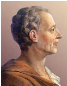
نگاره مونتسکیو (۱۶۸۹-۱۷۵۵م)

شارل مونتسکیو از متفکران عصر انقلاب فرانسه است. روح‌القوانین و نامه‌های ایرانی مهم‌ترین آثار اوست. او در نامه‌های ایرانی، از زبان دو مسافر ثروتمند ایرانی در فرانسه، به شکل غیرمستقیم آموزه‌های کلیسا و اخلاق عمومی فرانسویان را زیر سؤال می‌برد و از استبداد حاکم انتقاد می‌کند. مونتسکیو در مقدمه کتاب به کوفت‌فکری فرانسویان طعنه می‌زند که نمی‌دانند ایران کجاست و همچنین غیر از فرانسوی‌ها، ملت‌های دیگری نیز در جهان وجود دارند.