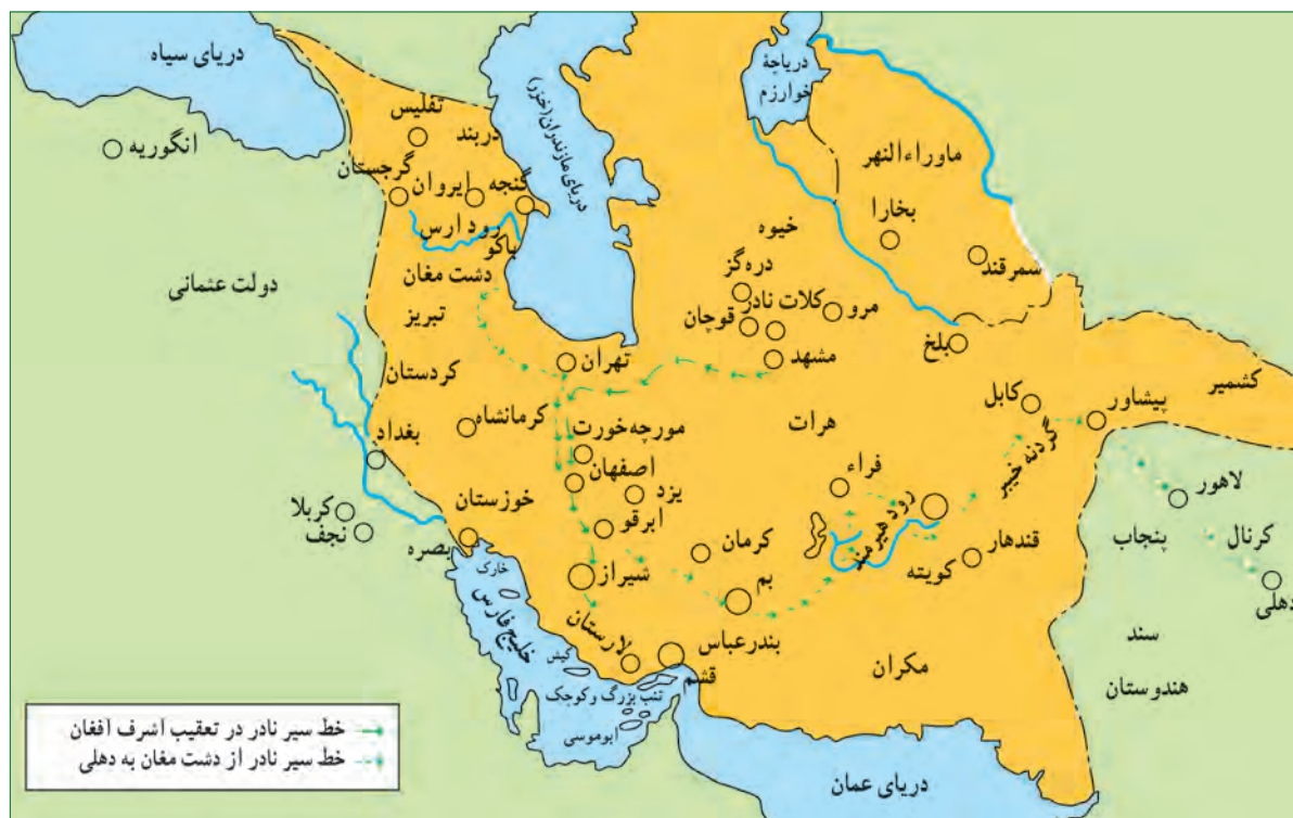
نقشه لشکرکشی‌ها و جنگ‌های نادر

سران ایل‌ها مانند نادر افشار و فتحعلی‌خان قاجار (پدر بزرگ آقامحمدخان) به او پیوستند و در نخستین گام، خراسان را تصرف کردند. پس از کشته شدن فتحعلی‌خان قاجار، نادر که جنگاوری شجاع و متهور بود، ابتکار عمل را به دست گرفت و