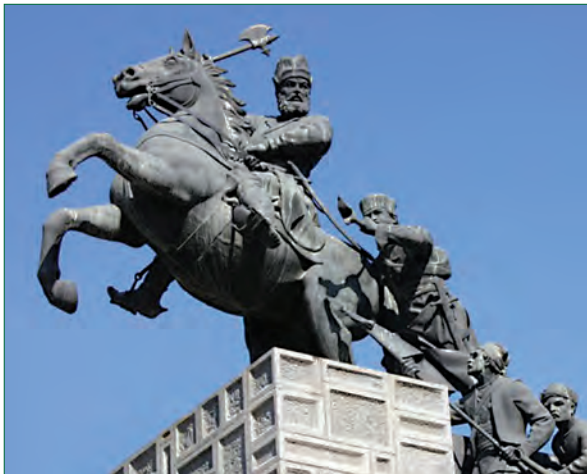
مجسمه نادرشاه افشار - باغ نادری - مشهد

با راهنمایی دبیر درباره زمینه و علل و عواملی که موجب شد ایلات و عشایر در تاریخ ایران دوران اسلامی، به خصوص پس از صفویه، نقش مهمی در تحولات سیاسی و برآمدن و زوال حکومت‌ها داشته باشند، بحث و گفت‌وگو کنید.