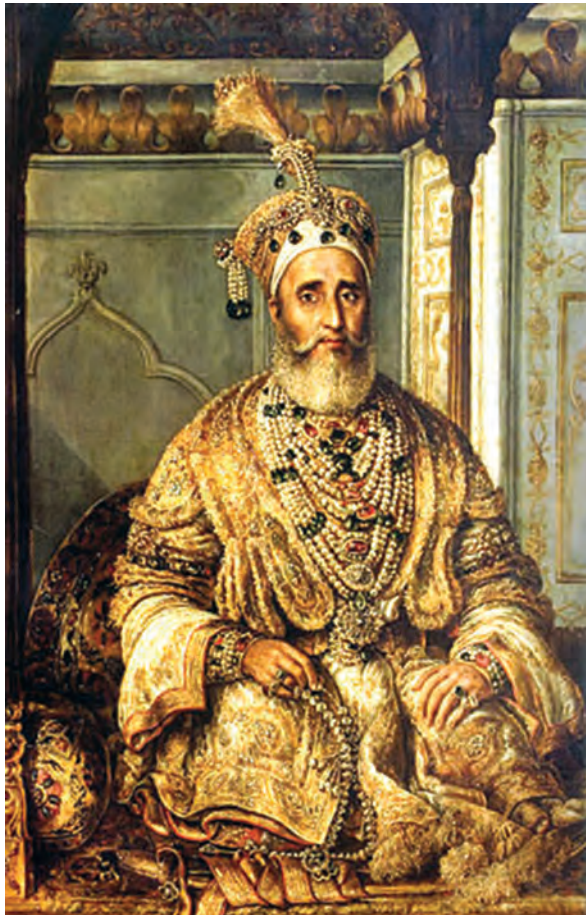
بهادرشاه دوم، آخرین فرمانروای گورکانی هند (۱۸۳۷-۱۸۵۷م) که کمپانی هند شرقی انگلستان او را از قدرت برکنار و به برمه تبعید کرد.

کمپانی هند شرقی فعالیت‌های استعماری خود را گسترش دادند. استعمارگران اروپایی به تدریج با دامن زدن به اختلافات دینی و قومی در هند، بخش‌هایی از آن سرزمین را تصرف کردند. در همان حال، میان استعمارگران رقابت شدیدی وجود داشت و جنگ‌هایی میان آنان در گرفت که با پیروزی انگلستان به پایان رسید. انگلیسی‌ها با غارت سرزمین ثروتمند هند قدرت خود را در جهان توسعه دادند و برای حفظ سلطه خویش، اقدام به دست‌اندازی بر سرزمین‌های مجاور و مداخله در امور کشورهای همسایه هند از جمله ایران کردند. سرانجام در سال ۱۸۵۷م پس از سرکوب شورش سربازان هندی، دولت انگلستان رسماً هند را جزئی از قلمرو خویش اعلام کرد و ملکه انگلستان به امپراتریس هند و بریتانیا ملقب شد.