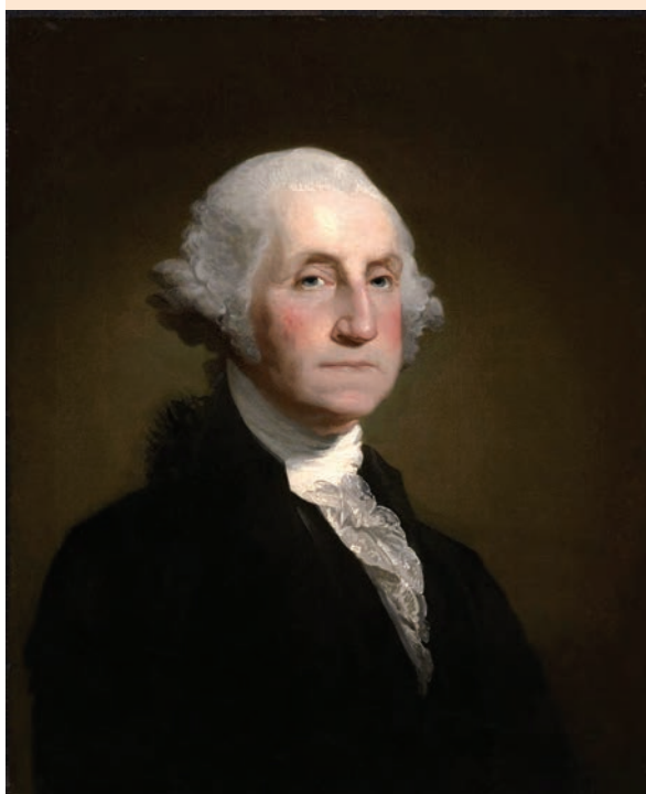
نگاره جورج واشینگتن (۱۷۲۲-۱۷۹۹ م)