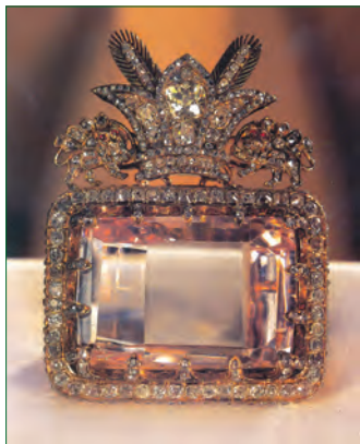
الماس دریای نور - موزه جواهرات ملی ایران

یکی از اقدامات نادر، لشکرکشی به هندوستان و جنگ گرنال بود. او به بهانه تعقیب افغان‌ها و اعتراض به اینکه پادشاه گورکانی هند، به آنها پناه داده است، به این کشور لشکرکشی کرد. البته برای این کار انگیزه مالی و اقتصادی نیز داشت؛ چون اداره ارتش بزرگ و پرشمار او بدون منابع مالی کافی ممکن نبود. نادر با پیروزی در جنگ گرنال، دهلی را تصرف کرد و به غنایم گران‌بهایی همچون الماس دریای نور، تخت طاووس و گنجینه‌های بزرگ جواهرات و کتب نفیس دست یافت و آنها را به همراه هزاران هنرمند و صنعتگر هندی با خود به ایران آورد.