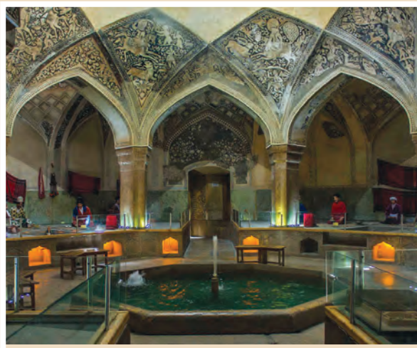
حمام وکیل - شیراز

کریم‌خان زند علاقه زیادی به ساختن بناهای باشکوه داشت. ساخت مجموعه مسجد و بازار و حمام وکیل، ارگ کریم‌خانی و بازسازی آرامگاه حافظ، سعدی و باغ دلگشا، گوشه‌ای از اقدامات عمرانی او در شیراز است. در دوره زند نوعی از بناها با کاربرد تفریحی گسترش یافت که به کلاه‌فرنگی معروف بود و آن بنایی کوچک و گاهی تزئینی بود که در وسط باغ‌ها یا تفریحگاه‌ها ساخته می‌شد.