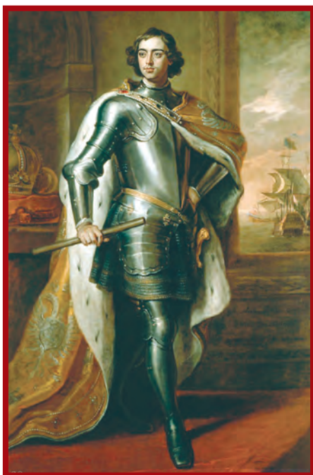
پتر کبیر، پدر روسیه جدید

۵- روسیه در مسیر توسعه‌طلبی نظامی؛ روسیه تا پیش از به قدرت رسیدن پتر کبیر (۱۶۸۲-۱۷۲۵م) کشوری عقب‌مانده و منزوی بود، اما سیاست و اقدام‌های پتر کبیر، این کشور را متحول کرد و در مسیر پیشرفت و توسعه‌طلبی سیاسی و نظامی قرار داد. او با استخدام کارشناسان اروپایی، تأسیس مدارس و دانشگاه‌های جدید و تقویت ارتش به ویژه نیروی دریایی این کشور را به قدرت بزرگی تبدیل کرد. یکی از برنامه‌های پتر برای قدرتمند شدن روسیه، گسترش سرزمین روسیه و دستیابی به دریاهای آزاد برای کسب منافع تجاری و سیاسی بود. جانشینان او تلاش کردند به این برنامه عمل کنند و به همین سبب در نواحی شرقی اروپا و حوزه دریاهای بالتیک، سیاه و مازندران (خزر) اقدامات نظامی وسیعی انجام دادند. این اقدامات موجب جنگ‌های متعدد روسیه با ایران، عثمانی و برخی کشورهای اروپایی، نظیر فرانسه، شد.