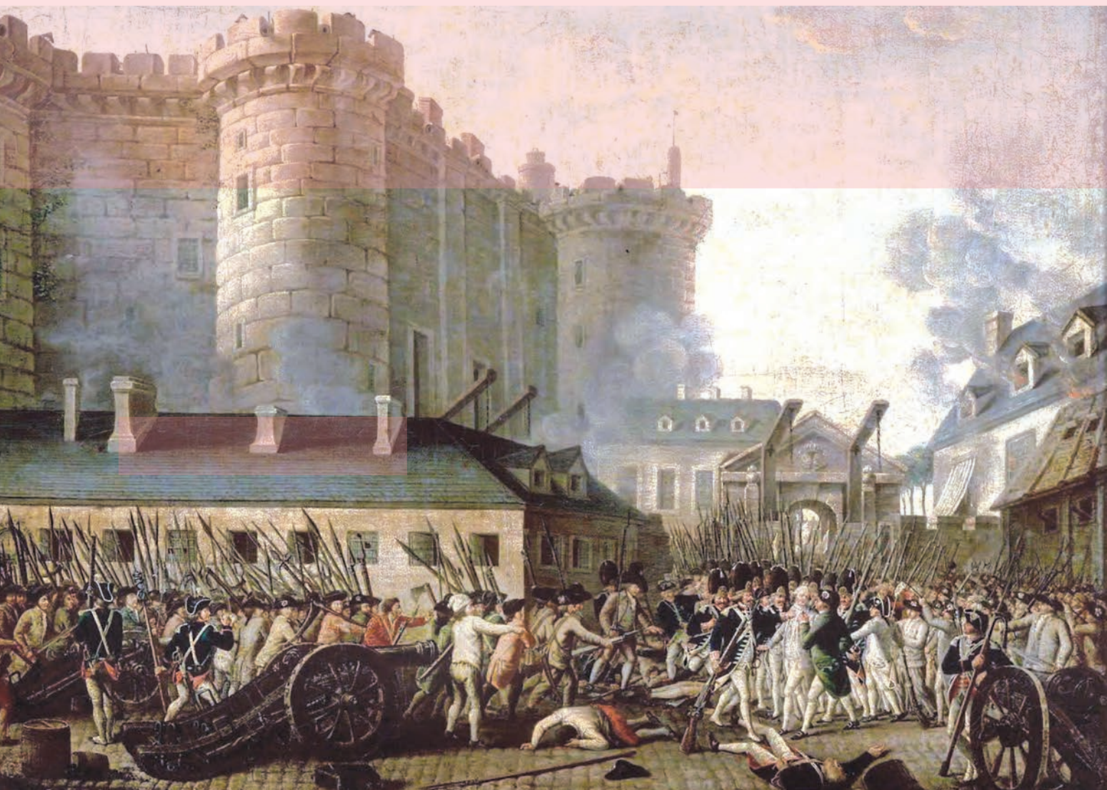
تابلوی نقاشی حمله انقلابیون فرانسه به زندان باستیل، نماد استبداد - پاریس - ۱۷۸۹م

سرانجام در ۱۴ ژوئیه ۱۷۸۹ مردم اغلب بینوا و خشمگین پاریس با حمله به زندان باستیل انقلاب خود را آغاز کردند. انقلابیون سرانجام لویی شانزدهم، پادشاه مستبد فرانسه، را وادار به امضای قانون اساسی جدید و پذیرش نظام مشروطه سلطنتی کردند. مدتی بعد، انقلابیون تندرو پادشاه را عزل و نظام جمهوری را برقرار نمودند. آنان سپس لویی و همسرش، ماری آنتوانت، را اعدام کردند. اعدام این دو و افکار و شعارهای آزادی خواهانه انقلابیون موجب ترس و خشم دولت‌ها در