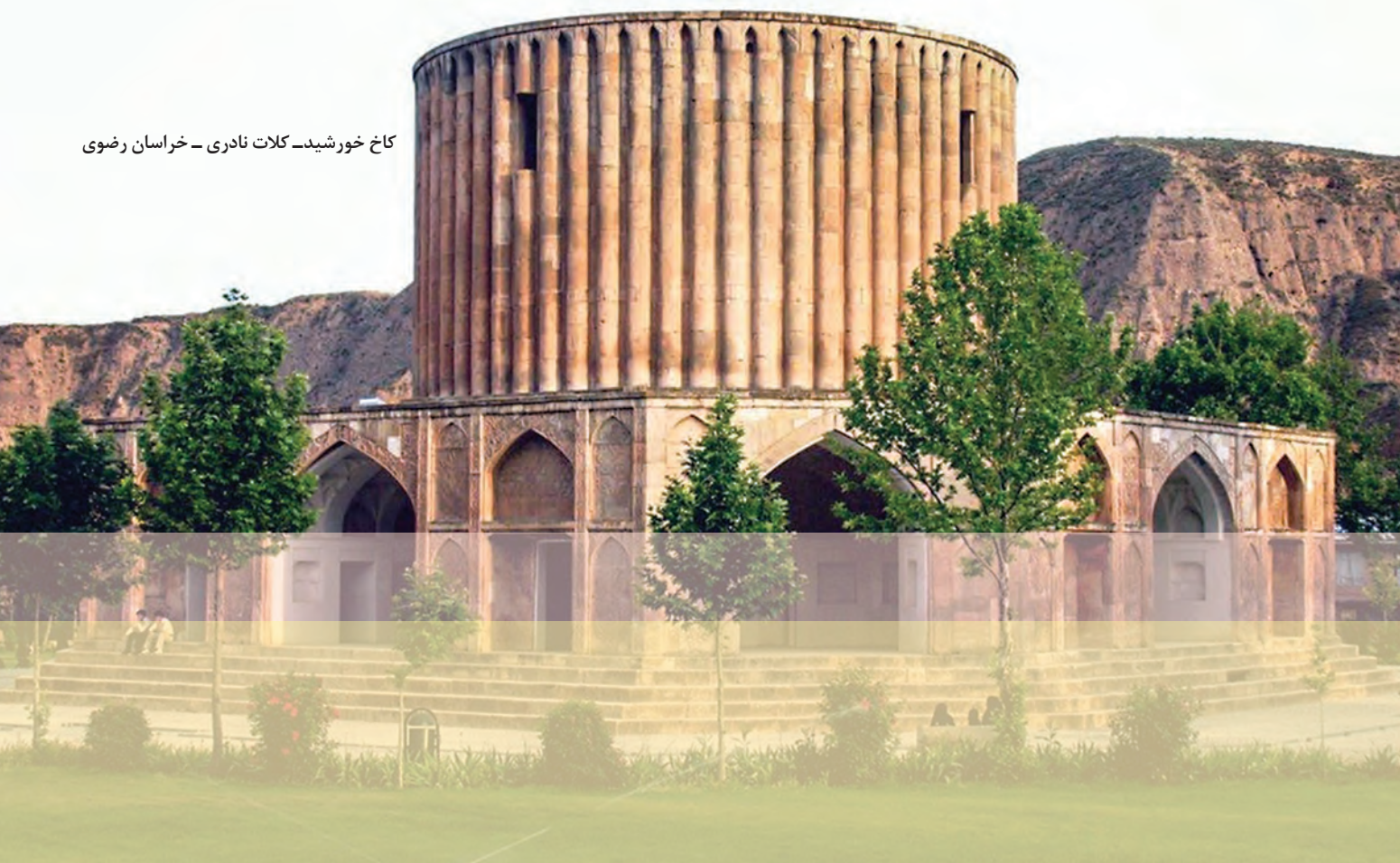
کاخ خورشید - کلات نادری - خراسان رضوی

به علت آشفتگی سیاسی و اجتماعی کشور پس از صفویان، امکان رشد و ترقی هنر و معماری دور از انتظار بود. با این حال، در زمان حکومت نادر شاه و دوره استقرار کریم‌خان زند در شیراز اقدامات قابل توجهی صورت گرفت. ورود هنرمندان و صنعتگران هندی پس از فتوحات نادر در هند، موجب تلفیق هنر ایرانی و هندی شد. مدارا و احترام کریم‌خان نسبت به هنرمندان و علما نیز موجب رونق هنر و معماری در زمان او شد. در دوره نادر شهر اصفهان بازسازی شد و در منطقه کلات که محل نگهداری خزاین نادر بود، بناهای باشکوهی مانند کاخ خورشید ساخته شد.