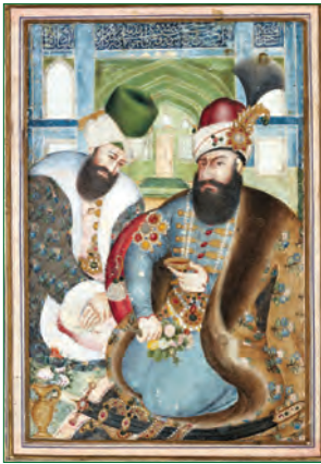
نگارهٔ کریم خان زند هنگام دیدار با فرستادهٔ عثمانی

کریم خان، برخلاف سنت معمول، از پذیرفتن عنوان شاه امتناع کرد و خود را وکیل مردم ایران (وکیل‌الرعايا) ۱ خواند. بعضی از خصوصیات اخلاقی کریم خان مانند مدارا با دشمنان، همدردی با مردم، ساده‌زیستی و رفتار مناسب با اقلیت‌های دینی و مذهبی باعث شده است که نام و نشان نیکی از او در تاریخ ایران به جا بماند.