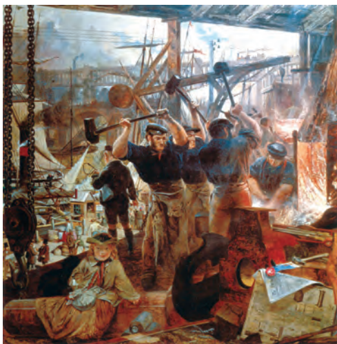
تابلوی آهن و زغال سنگ، اثر ویلیام بل اسکات، نقاش اسکاتلندی - اواسط سده ۱۹م

۴- انقلاب صنعتی، دگرگونی جهان: تا اواخر قرن ۱۸م عامل اصلی تولید نیروی بازوی انسان بود. صنعتگران برای تولید کالای بیشتر، مهارت های فکری، جسمی و هنری خود را به کار می بستند و از دیگر نیروهای طبیعت، مانند آب و باد، کمتر استفاده می کردند. در انقلاب صنعتی نیروی محرکه آب و سپس بخار جایگزین نیروی جسمی انسان شد. این انقلاب با اختراع و تکمیل ماشین بخار در انگلستان آغاز گردید. نخستین تحول صنعتی در نساجی و پارچه بافی صورت گرفت. سپس، این انقلاب در کشاورزی، حمل و نقل و دیگر بخش های تولید نیز رخ داد و در نتیجه آن، تولیدات صنعتی افزایش قابل توجهی یافت.